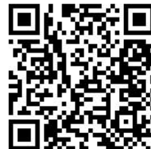
ละเอียดการสมัคร ภาษา